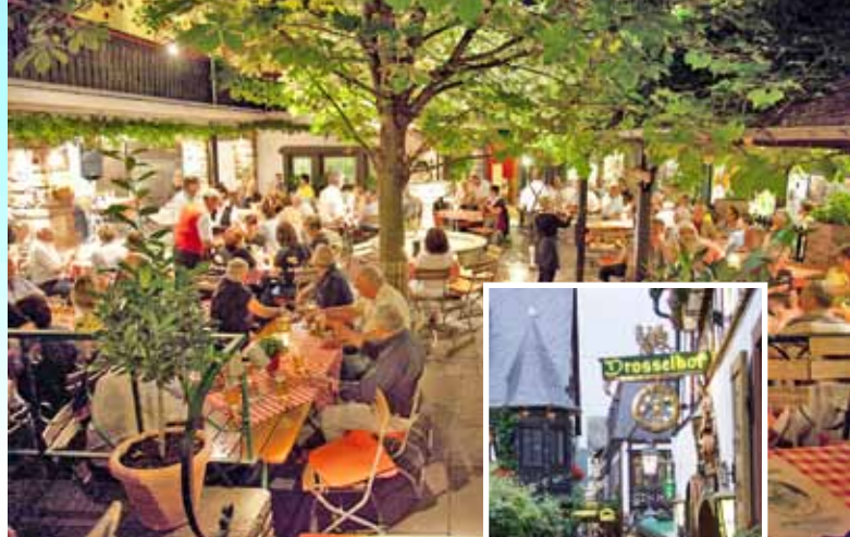
Rudesheim 1e nacht

Dinsdag 18/6: Mooie route door het natuurpark terug naar de Main voor een uiterst toeristische route langs twee mooie maar onbekende zijrivieren: de Erta en de Tauber. We lunchen aan de Main in het gezellige stadje Wertheim, en rijden daarna mooi terug naar het hotel.