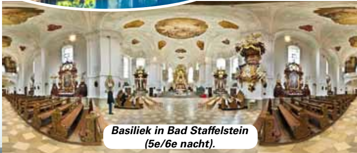
Basiliek in Bad Staffelstein (5e/6e nacht).

Woensdagmorgen 19/6: Via een bochtige route door het natuurpark pikken we de Main nabij Wertheim weer op in Marktheidenfeld en volgen de rivier met bezoeken aan enkele oude stadjes stroomopwaarts, tot aan de lunch in de oude stad Würzburg, hoog boven de Main gelegen.