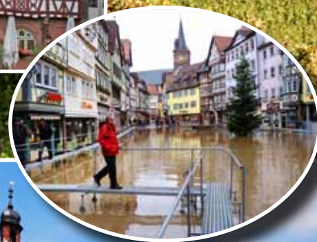
5e dag Bamberg