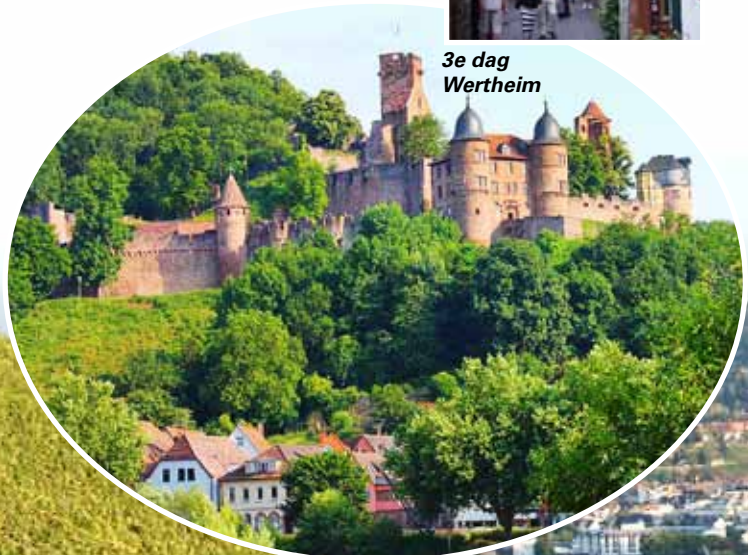
3e dag Wertheim