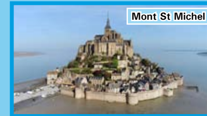
Mont St Michel