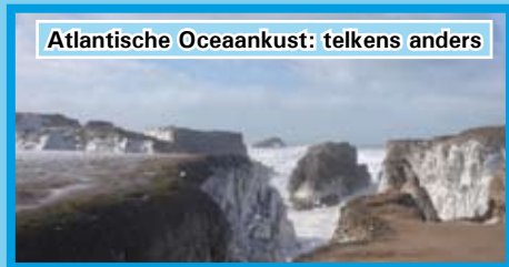
Atlantische Oceankust: telkens anders