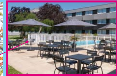
Start: Do 1x CAEN