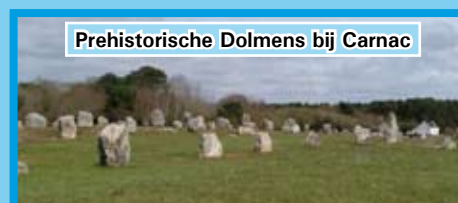
Prehistorische Dolmens bij Carnac