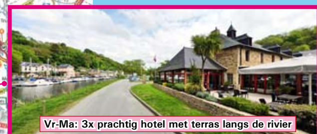
Vr-Ma: 3x prachtig hotel met terras langs de rivier