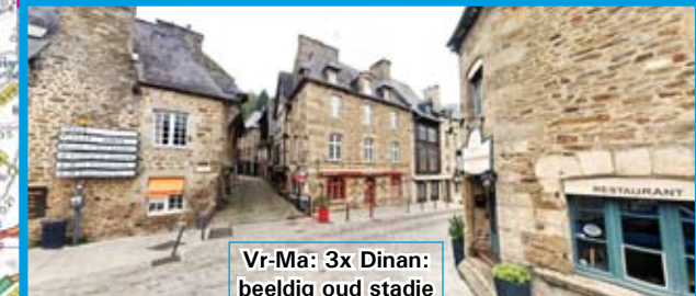
Vr-Ma: 3x Dinan: beeldig oud stadje onder St-Malo