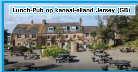
Lunch-Pub op kanaal-eiland Jersey (GB)